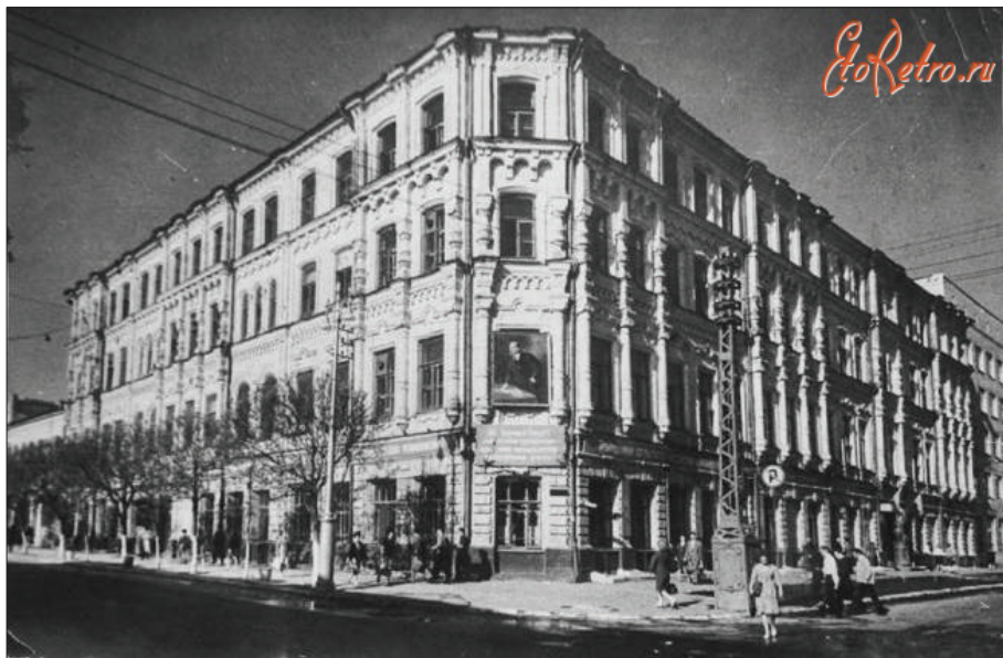
Саратовский сельскохозяйственный институт