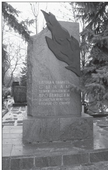
Памятник погибшим во время пожара. Новозападное кладбище г. Пензы