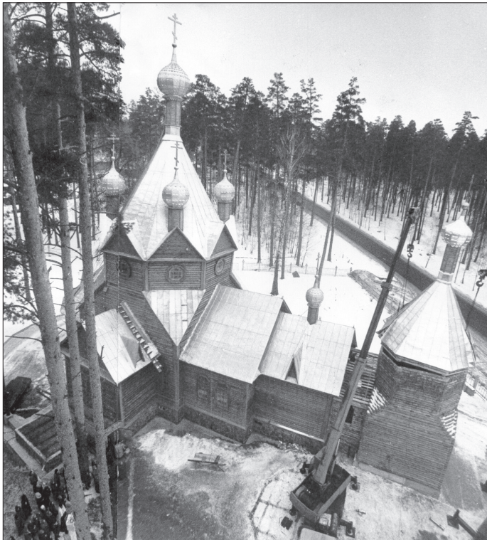
Освящение и водружение на колокольню шатра. 16 декабря 1999 г.