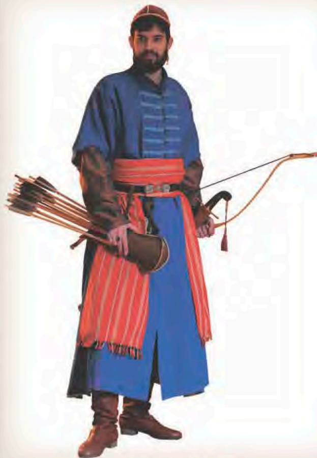
Служилый татарский мурза