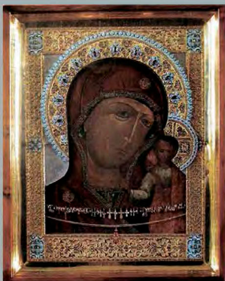
Казанская икона Божьей матери.