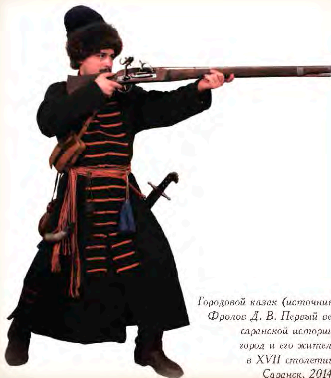
Городовой казак

— донесение прапорщика Языкова ландрату Льву Аристову из Мокшана о том, что «кубанцы по ведомостям являются в Пензенском уезде в круге Драгунских Липягов; и по оным ведомостям... с командою своею онаго ж августа 11-го числа пошел туда» (XV).